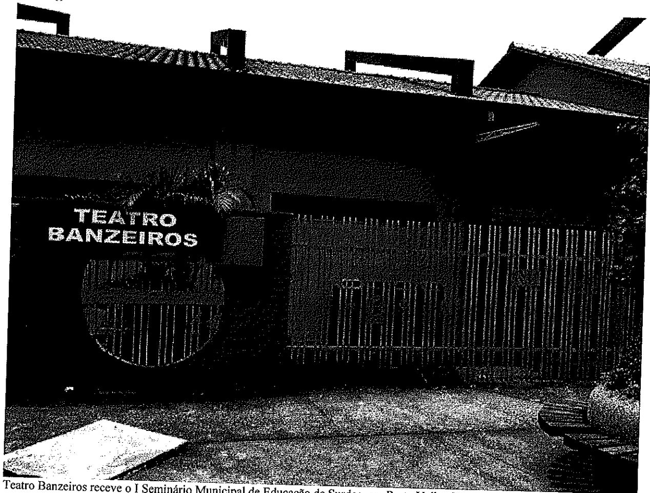
Teatro Banzeiros recebe o I Seminário Municipal de Educação de Surdos, em Porto Velho

Evento acontece nesta sexta, 28, no Teatro Banzeiros, em Porto Velho. Palestras são ministradas por educadores da Unir, Semed e Escola Bilingue.