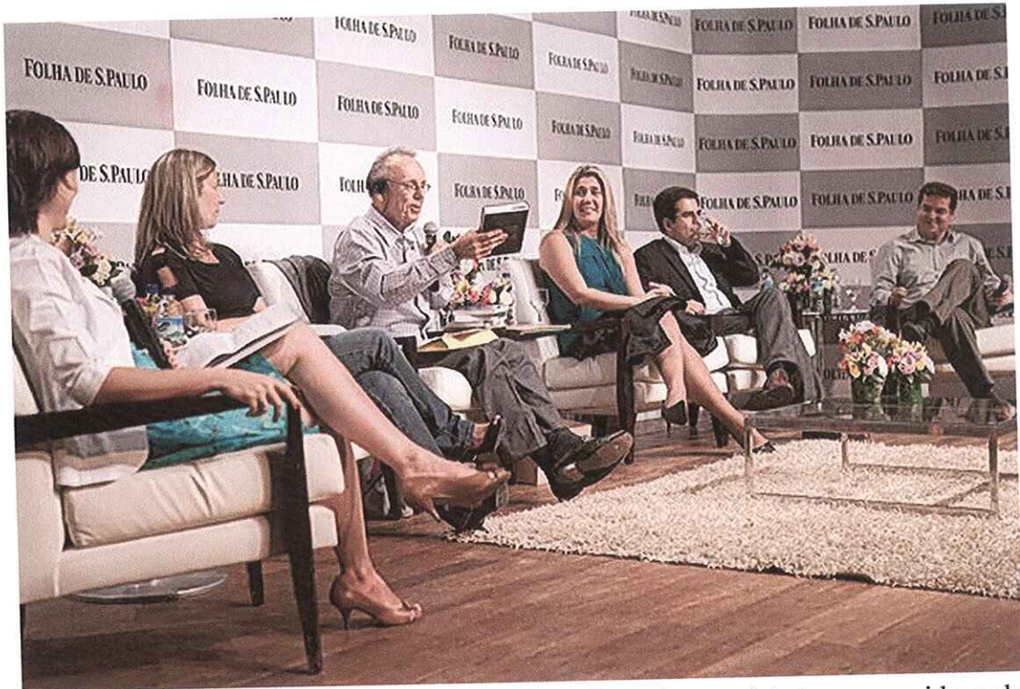
Convidados falam sobre o uso do tablet na infância em debate promovido pela 'Folhinha'

Essa foi uma das sugestões do debate "Tablet na Infância - Educação e Entretenimento", realizado anteontem, no Teatro Folha, em São Paulo. O encontro, promovido pela "Folhinha", teve parceria do Instituto Ayrton Senna e foi acompanhado por 190 pessoas, a maioria professores e pais. Durou quase três horas e foi caloroso, com embate entre ideias opostas e manifestação da plateia.