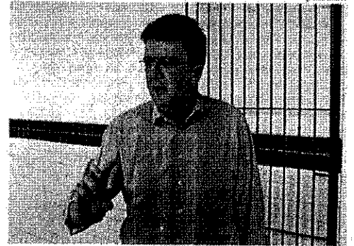
Secretário diz que estado vai melhorar no próximo Ideb

Nos próximos dias, deve rolar uma análise cuidadosa dos resultados de cada escola pra ver o que mais pode ter influenciado no resultado do Ideb. É o caso da Carlos Fantini, do bairro peixeiro do Limoeiro, que passou 2013 praticamente fechada pra reforma. Nas séries iniciais (quarta série/quinto ano), as notas da unidade escolar caíram de 5,6 em 2011 para 4,8 na avaliação feita ano passado. Nas séries finais (oitava série/nono ano), a queda foi de mais de um ponto: de 4,3 passou pra 3,2. "Carlos Fantini é o caso típico de você olhar o resultado do Ideb e ver que teve um fator externo muito forte pra que você não tivesse uma melhoria. Por isso, a gente