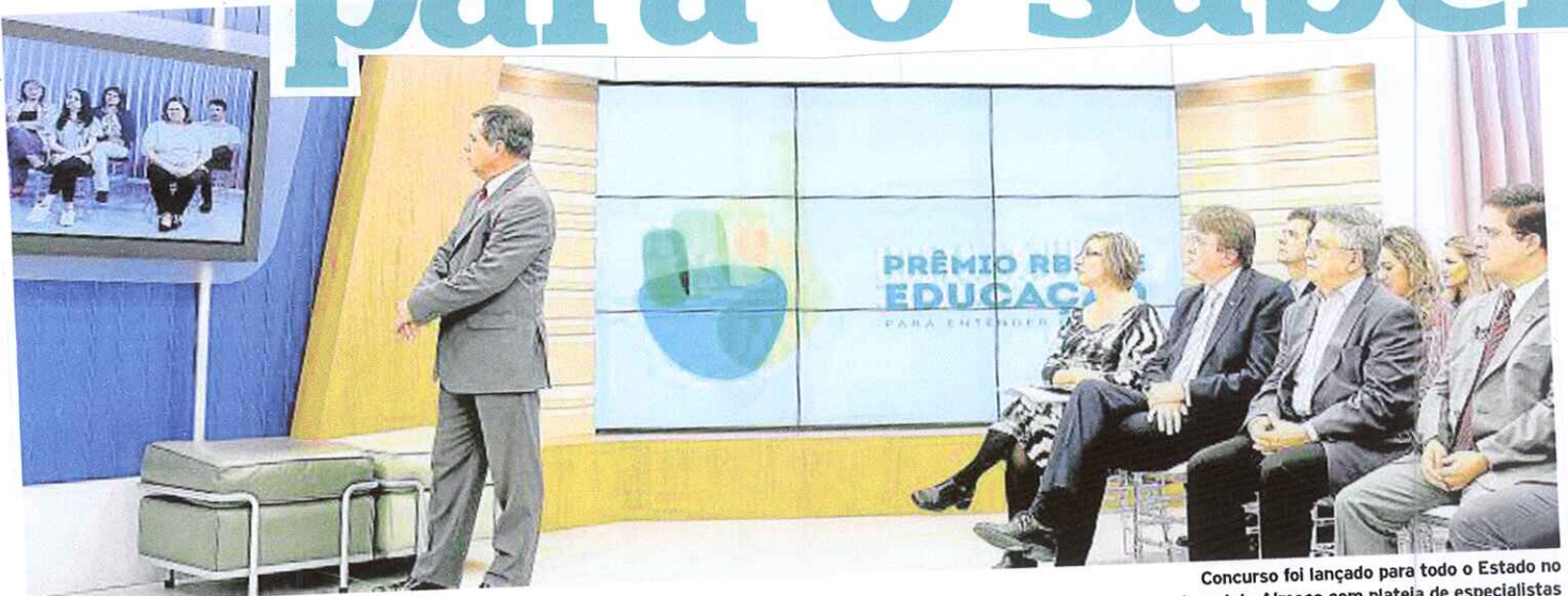
Concurso foi lançado para todo o Estado no Jornal do Almoço com plateia de especialistas