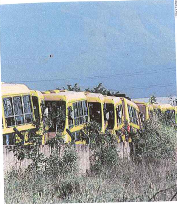
No terreno da Iveco em Palhoça, os 133 ônibus fabricados pela empresa para serem distribuídos no Estado aguardam a entrega