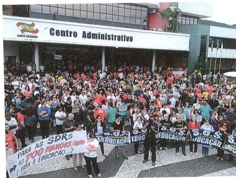
Assembleia ocorreu na tarde desta quinta (25)

Em terceiro dia de greve, magistrado quer adequação do piso nacional. Secretário de Educação diz que cumpre exigência e paga o piso.