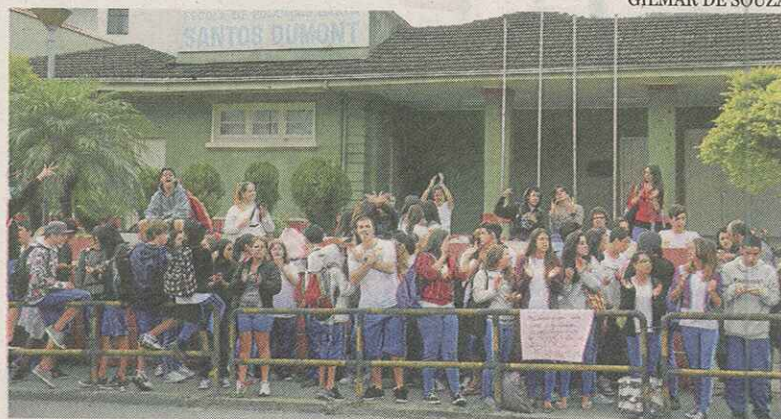
Manifestação reuniu estudantes da Escola Santos Dumont

- É uma falta de esclarecimento dos estudantes que não vieram buscar uma explicação. Esta é uma adequação de espaço, que existe há anos, decorrente de perda de aluno ao longo do ano e de transferência de turnos.